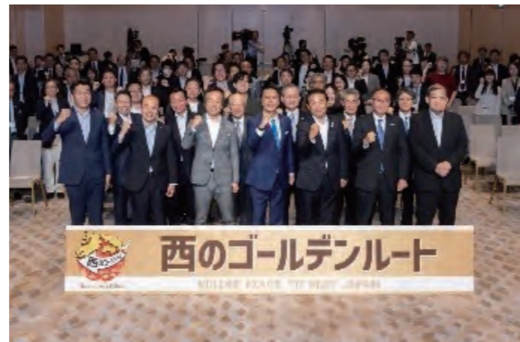
5月17日/西のゴールデンルートアライアンス設立総会

約150の自治体、広域連携DMO、民間事業者等をメンバーとする西のゴールデンルートアライアンス設立総会とカンファレンスを開催。