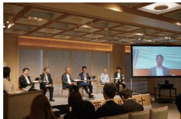
7月22日 第1回メンバーズセミナー